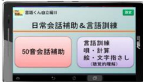
自立編Ⅲ 定価 124,300 円 (税込)

ご利用者の 70% が「よくなっている」と感じています。 まずは、10 日間の無料お試し訓練を体験してください。