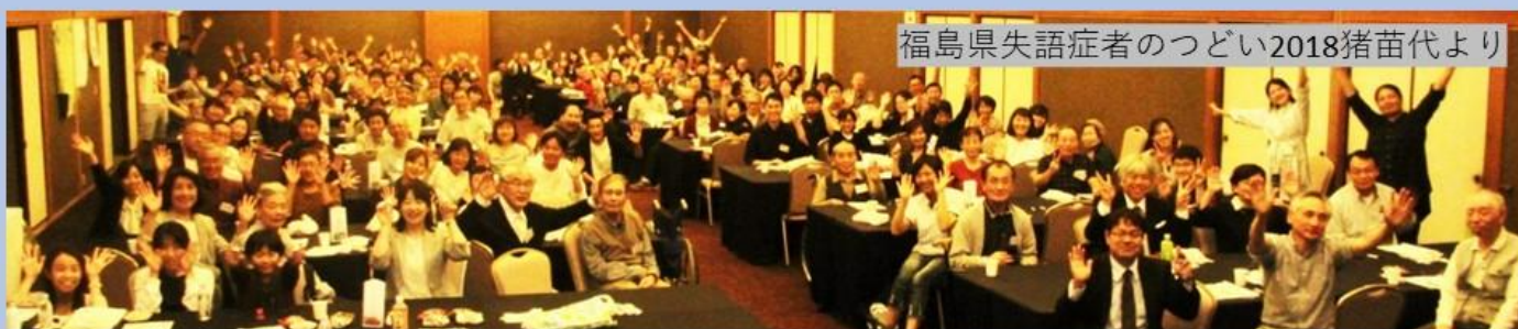
福島県失語症者のつどい2018猪苗代より

2023年山梨大会からのバトンを受けて、2024年は福島で全国大会を開催いたします。秋の福島で皆様をお待ちしております。乞うご期待!!